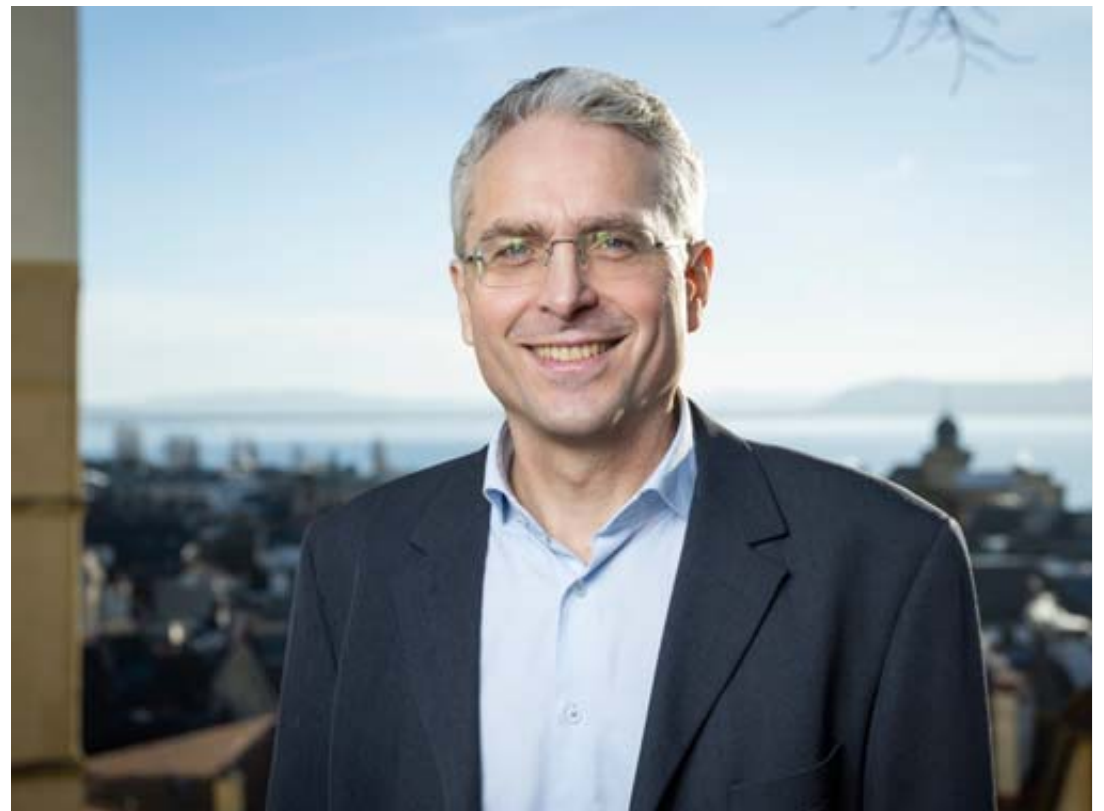
Selon Roland Nötzel, «les défis restent nombreux, en raison du caractère multifactoriel de la démographie».