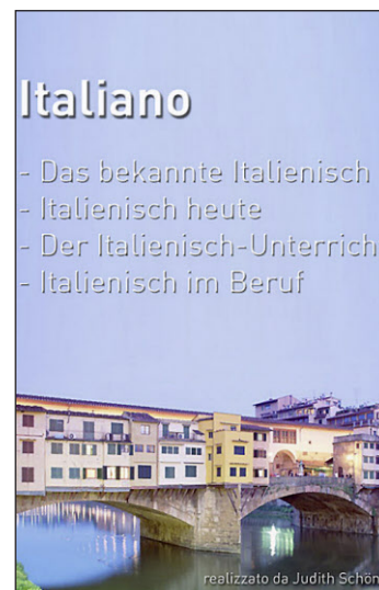
Die DVD soll den Jugendlichen das Italienisch näherbringen.