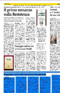
TAVOLA ROTONDA Riflessioni suggerite dalla esposizione sulla Fiera svizzera in corso a Villa Ciani ancora fino al 2 febbraio Il passato vince sulle incertezze del presente