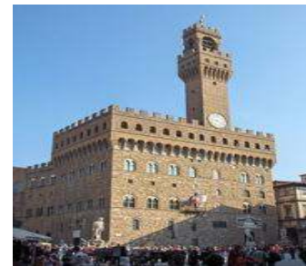
Firenze – Palazzo Vecchio

E' impegnato nella consultazione sulla messa a punto dell'Ordinanza d'applicazione della Legge federale sulla cultura e continua la sua strategia per promuovere un federalismo ed una società plurilingue "senza plurilinguismo, niente Svizzera". Questa attività troverà nel mese di maggio una valorizzazione a Firenze presso la sede dell'Accademia della Crusca dove la Svizzera sarà l'ospite privilegiato durante la manifestazione "Piazza delle lingue 2009"