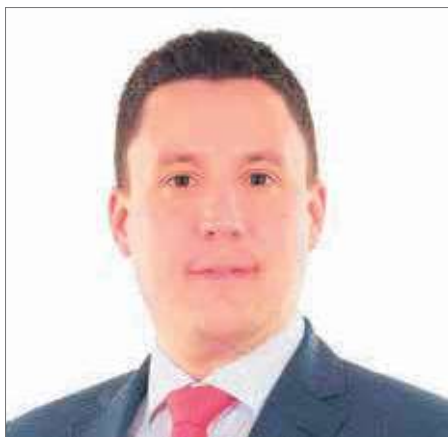
Piero Marchesi, imprenditore, deputato al Consiglio nazionale per l'Unione Democratica di Centro

Per questo, una sana reazione d'orgoglio non farebbe male, quale riposta allo "specchio per le allodole" rappresentato dal minor costo proposto dall'iniziativa.