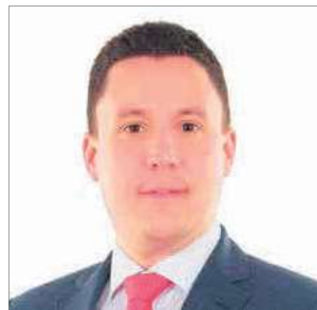
Piero Marchesi, deputato al Consiglio nazionale per l'Unione Democratica di Centro