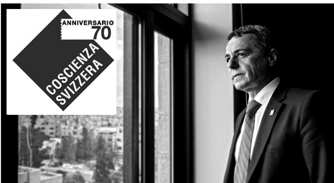
Nichtstun führe in den Zustand einer Rechtsunsicherheit, meint FDP-Bundesrat Ignazio Cassis

Rahmenabkommens und wies Voten zurück, wonach man doch zuwarten solle, solange sich die EU in einer Krise befände. "Nichtstun ist kein guter Weg, denn er führt in den Zustand einer Rechtsunsicherheit, die für Investoren sehr schädlich ist", so Cassis. Die EU bekämpft im Rahmen der Verhandlungen